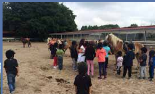
Une sortie « poneys », une belle expérience.