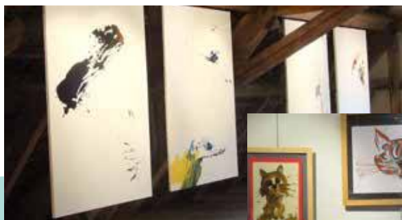
Toiles de Dominique Starck.