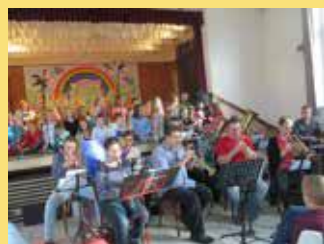
Les enfants et la Musique Municipale.