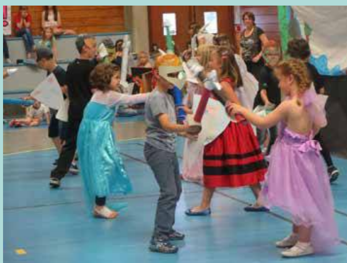
Une improbable bataille entre princesses et chevaliers.

Pour fêter la fin de l'année scolaire, l'Accueil de Loisirs et Périscolaire ALEF nous a fait voyager « de la préhistoire à nos jours ». Sketches, danses, chants, pour accompagner les différentes époques en partant des dinosaures, des hommes de Cro-magnon et un passage dans l'antiquité ; chevaliers et princesses pendant le moyen-âge et une Marseillaise pour marquer la Révolution ; explorateurs et navigateurs nous amènent aux temps modernes pour finir avec des danses contemporaines.