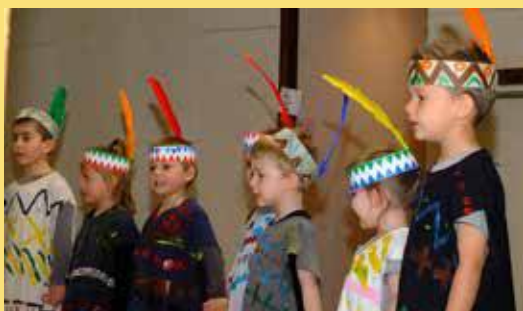
Joliment déguisés pour la fête des indiens !

Un repas a réuni petits et grands, très nombreux, dans la salle du foyer pour prolonger la fête.