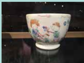
Poterie de style naïf de Pascal Stecher.