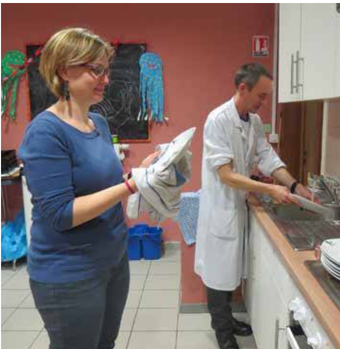
Un collaborateur de l'EFS n'hésite pas à s'associer aux bénévoles.