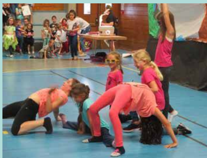
Nos petits acrobates en herbe.