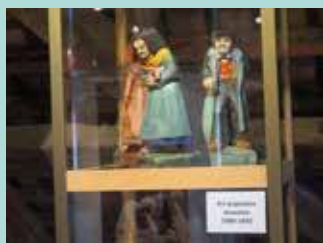
Art populaire alsacien et art déco de Léon Elchinger.