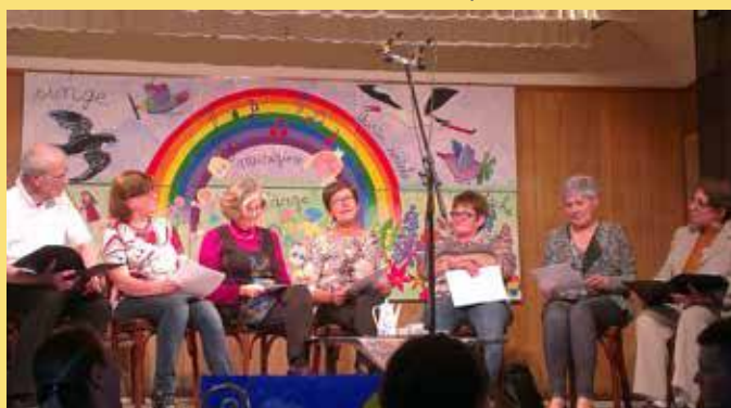
« Sprichwerter in de Maïstubb » : une soirée de dictons.