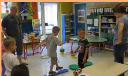
Un parcours sans faute !

Et les multiples stands gourmands n'ont pas été les moins investis !