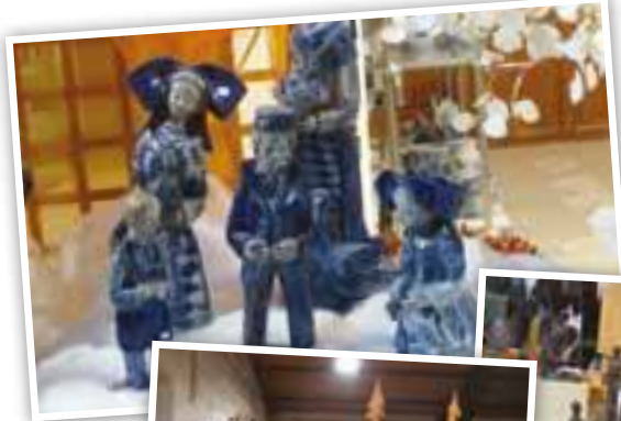
< Marché de Noël, un atelier tricot un peu spécial...

À Betschdorf, le Musée de la Poterie, ouvert au public pour l'occasion, a proposé des ateliers, démonstrations, et un charmant petit marché de Noël fourmillant d'objets proposés par les écoles.