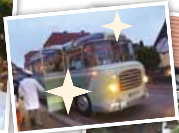
✓ Un autocar ancien a fait la navette entre les différents lieux d'animation