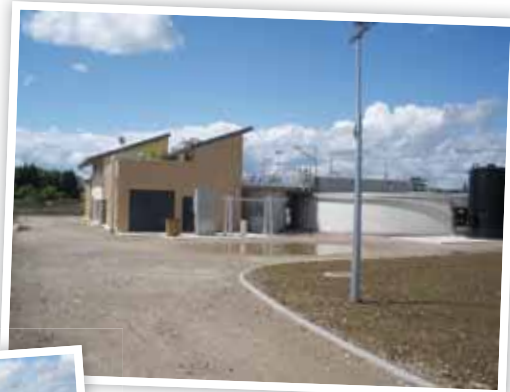
^ Vue générale de l'entrée

Le Syndicat de l'eau et de l'assainissement d'Alsace-Moselle, maître d'ouvrage de la construction, et la commune inviteront la population à une visite du nouveau site d'épuration cet automne. La date sera communiquée ultérieurement dans les différents supports d'information communaux (vitrine d'affichage, panneau électronique) et nous vous incitons à les consulter. ■