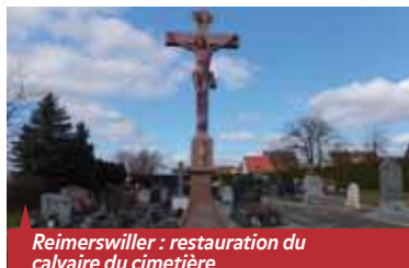
Reimerswiller : restauration du calvaire du cimetière