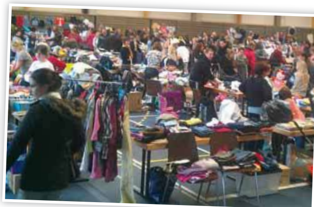
^ Bourse aux vêtements

Nous profitons de cette tribune pour lancer un appel à tous les habitants qui en ont la possibilité : stocker le vieux papier jusqu'au prochain ramassage qui aura lieu le samedi 27 septembre 2014 à partir de 9h00.