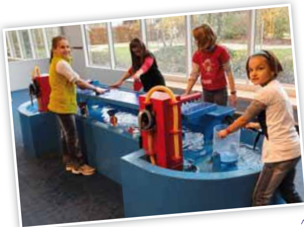
^ Visite du Vaisseau