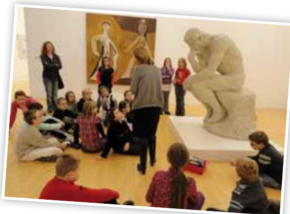
> Découverte de l'art

D'autres actions de plus petite envergure comme la vente de calendriers, de bouquets de fleurs, complètent les deux actions précédentes.