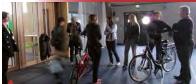
Les nouveaux outils de l'éco-mobilité étaient présentés.

Cette manifestation a pu avoir lieu grâce au soutien de différents partenaires comme la Fédération des usagers de la bicyclette (FUB), le Conseil Général