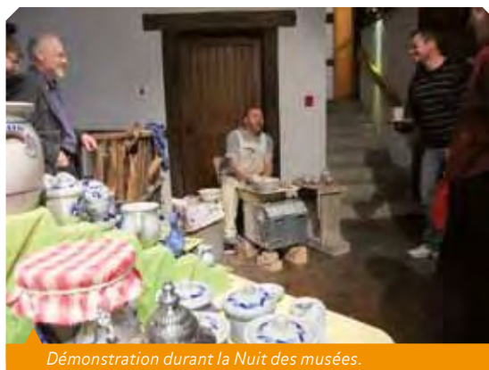
Démonstration durant la Nuit des musées.