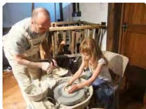
< L'émotion de la création.