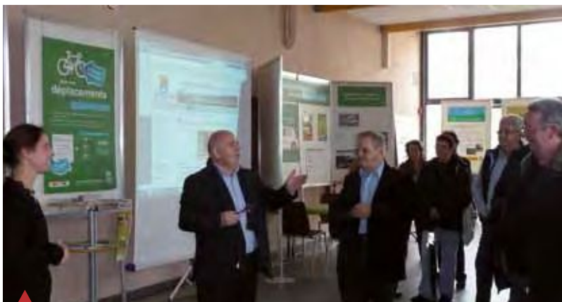
L'inauguration de l'exposition en présence du président de l'Adéan.

Le diagnostic ainsi établi a permis de préconiser à la commune des pistes d'action pour améliorer les déplacements à l'intérieur et en-dehors de la commune.