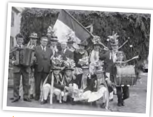
^ Conscrits de la classe 1947-1967.