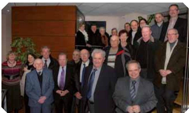
< Une belle rencontre intergénérationnelle.

Vision, volonté, confiance ont été les mots utilisés à la fois par les représentants de la municipalité actuelle, mais aussi par les élus d'il y a 40 ans réunis à la cérémonie organisée à la mairie le 15 février 2013 pour fêter le 40 e anniversaire de la fusion des communes .