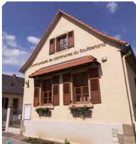
Le futur siège de la Communauté de communes de l'Outre-Forêt.

Le travail en commun entre les deux structures est un fait précédemment établi. En effet, les deux Communautés de communes partagent déjà des structures communes pour le Relais d'Assistance Maternelle et pour les services aux personnes âgées. Par ailleurs, le Conseil général du Bas-Rhin a intégré les deux Communautés de communes dans un même contrat de territoire qui recense tous les projets à la fois communaux, mais aussi intercommunaux sur la durée de la dernière mandature. Sous réserve de l'évolution des données statistiques de la population des communes membres et sous réserve de la confirmation par la Direction générale des Collectivités locales, le conseil communautaire serait constitué de 30 délégués. Leur nombre varie d'une commune à l'autre en fonction de son poids démographique. Ces conseillers communautaires seront élus lors des prochaines élections municipales par un système de "fléchage" sur les listes communales.