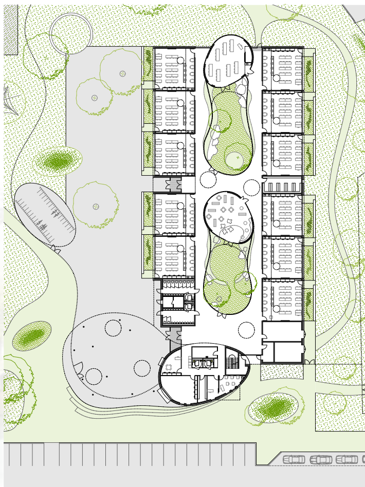
Plan du rez-de-chaussée. ©Auger-Rambeaud Architectes.