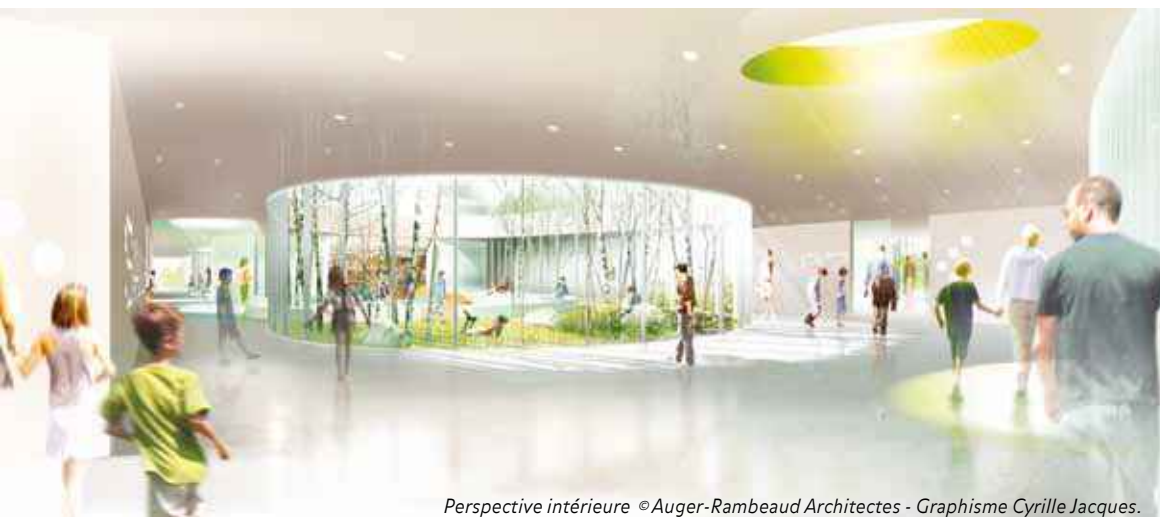
Perspective intérieure ©Auger-Rambeaud Architectes - Graphisme Cyrille Jacques.

La collecte du mardi 24 décembre est avancée au lundi 23 décembre.