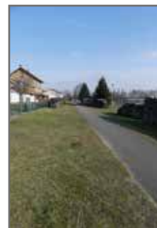
Illumination de la piste cyclable au droit de l'ancienne gare 16 000€