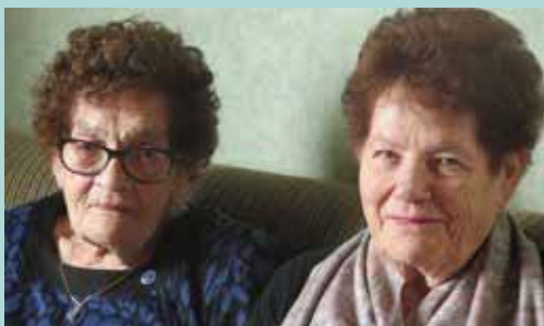
Mère et fille, 180 ans à elles deux