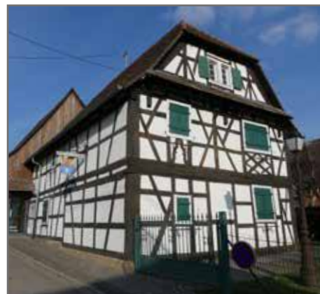
Musée de la poterie : création de 2 postes d'hôtesse d'accueil et d'une mission de service civique 25 000€