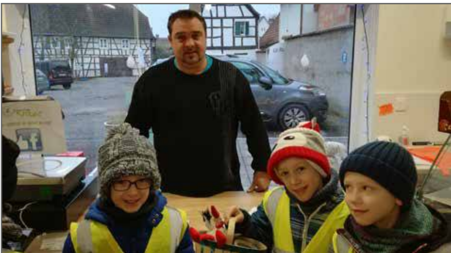
À Esprit Vrac