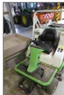
Remplacement tondeuse services techniques 36 000€