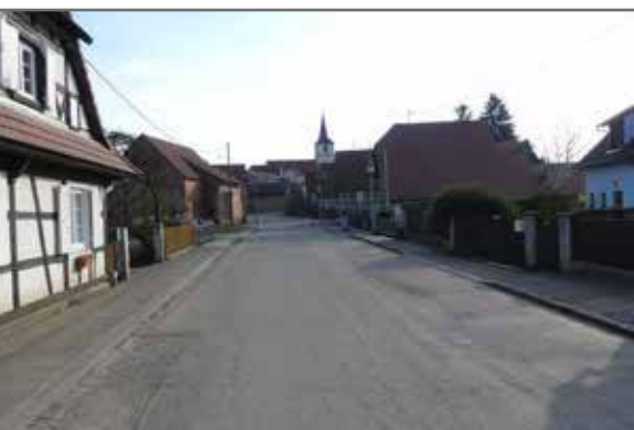
Éclairage public rue des francs, de l'angle, impasse du Haesel 100 000€

SI LES TRAVAUX DE RÉNOVATION DE LA TRAVERSE DE SCHWABWILLER SONT IDENTIFIÉS COMME OPÉRATION MAJEURE POUR L'ANNÉE 2018, LE CONSEIL MUNICIPAL A FIXÉ D'AUTRES PRIORITÉS DANS DE NOMBREUX DOMAINES :