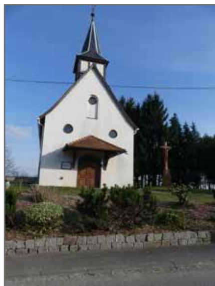
Eglise catholique de Reimerswiler : • Restauration du beffroi • Mise en conformité des installations électriques 13 000€