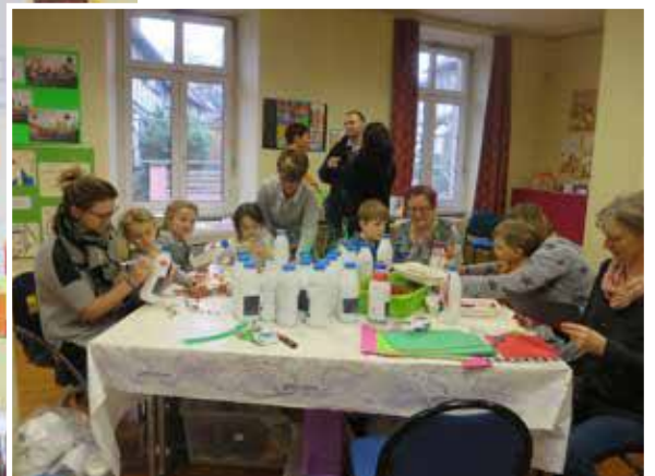
Les activités de l'association MAIL sont toujours très appréciées.

Bricolages, collages...des couleurs qui font rigoler les murs.