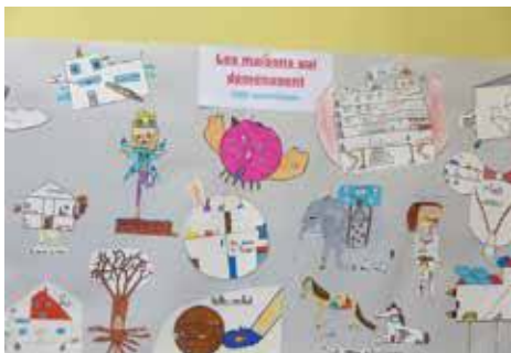
Des maisons qui déménagent.

Une intéressante collection «Maisons du Monde», prêtée par la Bibliothèque Départementale du Bas-Rhin, un atelier numérique de liseuse et tablette et un jeu-concours ont agrémenté cet événement.