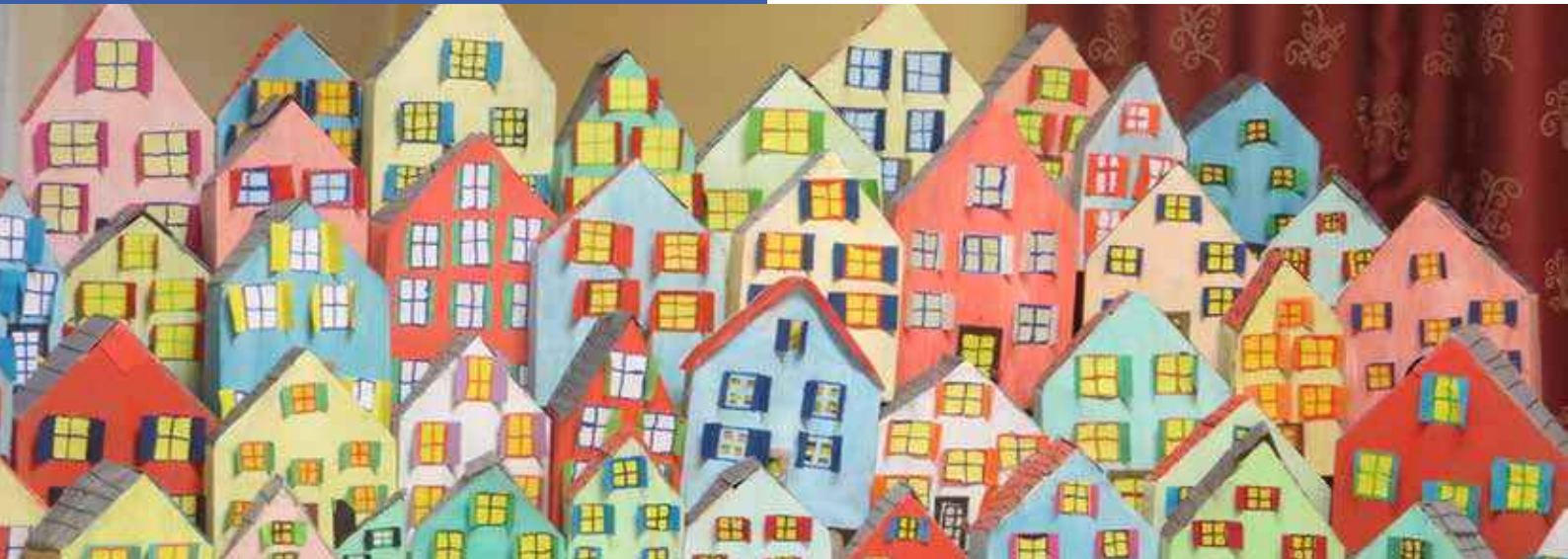
Un bien joli village.