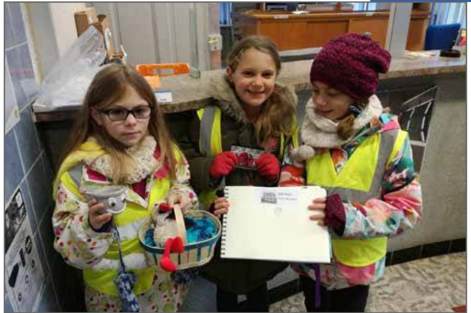
À la Poste

Pour les élèves, ce projet créatif est l'occasion de faire de la géographie et de pratiquer l'allemand tout en s'amusant.