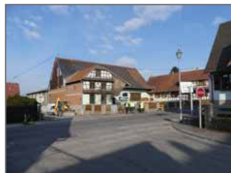
Traverse de Schwabwiler (voirie, réseaux secs) 800 000€