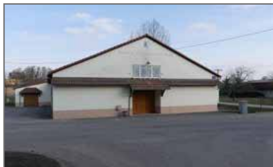
Maison de la culture et des loisirs Mise en accessibilité des sanitaires 100 000€