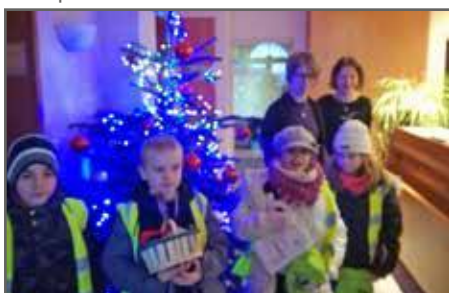
À la mairie