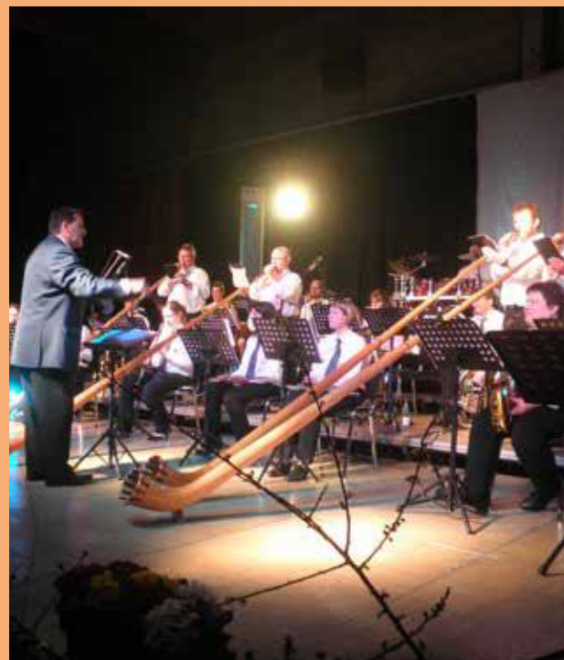
Avec les Cors des Vosges du Nord

Un programme éclectique et varié dans l'excellence et la bonne humeur, une prestation réussie