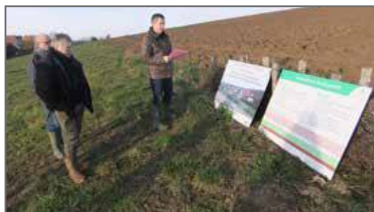
Coulées d'eaux boueuses Reimerswiler Finalisation – choix des scénarii 30 000€