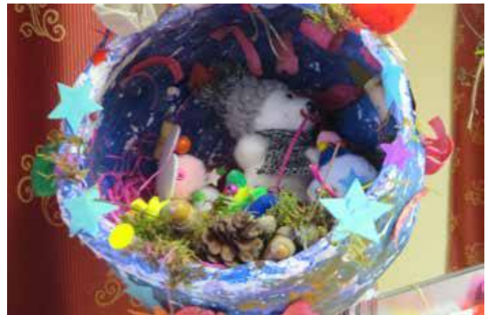
Une drôle de maison pour drôles d'oiseaux.