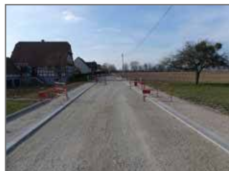
Rue du Surweg 62 000€