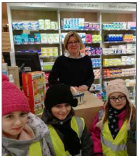
À la pharmacie