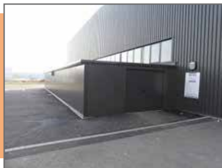
Extension EST de l'ESCAL 52 000€