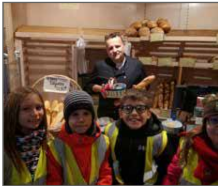
À la boulangerie Jund