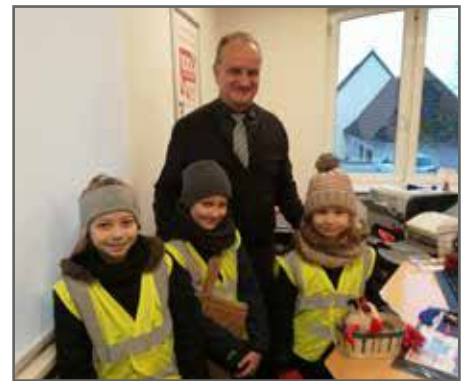
Au Crédit Mutuel