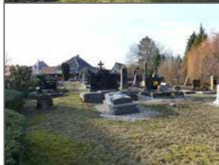
Aménagement paysager cimetières Ober et Kuhlendorf 12 000€