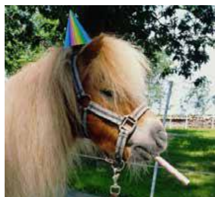
Django déguisé à l'occasion d'un anniversaire