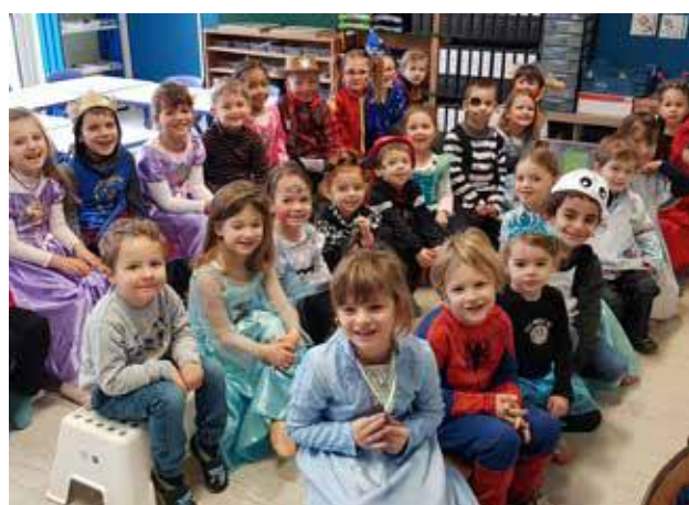
Moyenne et grande sections de la classe 1