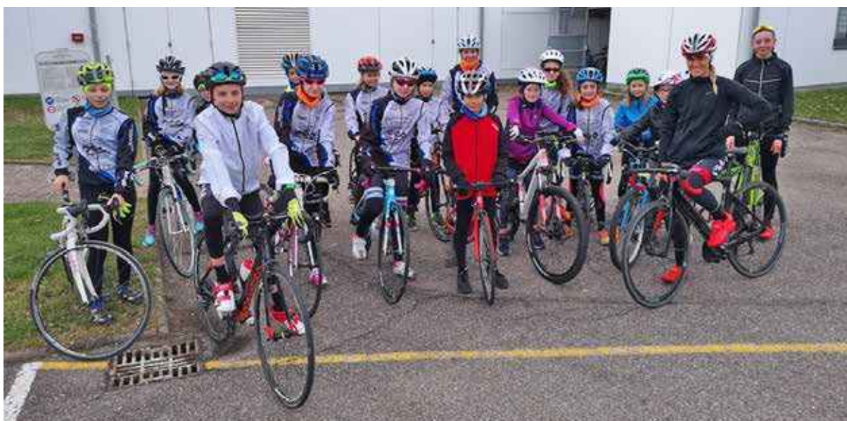
Sortie vélo pour les jeunes du club