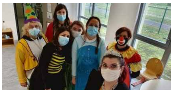
Une partie de l'équipe d'encadrement