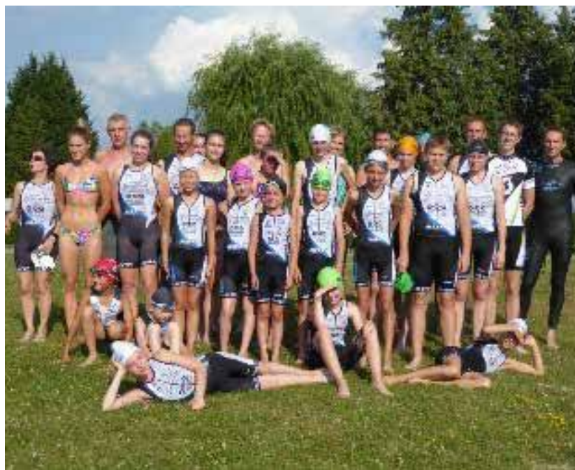
Le NAVECO lors d'un entraînement au Staedly à Roeschwoog.

Depuis quelques années maintenant le club est labélisé « ECOLE DE TRIATHLON deux étoiles » sur trois possibles en France. La priorité est donnée aux