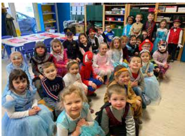
Moyenne et grande sections de la classe 2